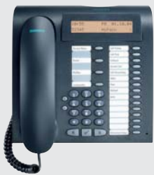
optipoint 500 advance il telefono digitale più evoluto: display retro illuminato, 2 porte per adattatori, 19 tasti funzione con LED, interfaccia USB, funzione viva voce full-duplex di alta qualità, una porta per cuffia