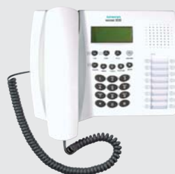
Profiset 3030 il telefono con compatibilità BCA dalle elevate prestazioni, Viva voce full-duplex display retro illuminato, 16 tasti programmabili e CLIP