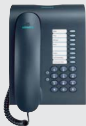
optipoint 500 entry l'economico telefono digitale con ascolto amplificato e 8 tasti funzione

Alcuni modelli integrano la funzione viva voce per telefonate ancora più facili mantenendo inalterate le qualità delle comunicazioni. I telefoni sono disponibili in due colori: artic e manganese.