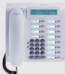
optipoint 500 basic il telefono digitale con interfaccia USB integrata, display, ascolto amplificato e una porta adattatore