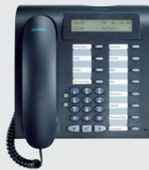
optipoint 500 standard il telefono digitale con display, funzione viva voce full-duplex di alta qualità, interfaccia USB e una porta adattatore